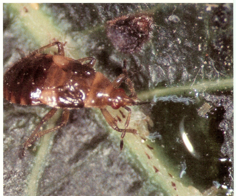
NYMFE PÅ JAGT - Pærenæbtægenymfe med 'snablen' i en dråbe honningdug på jagt efter pærebladlopper. Der sidder en lille bladluppenymfe i honningduggen.