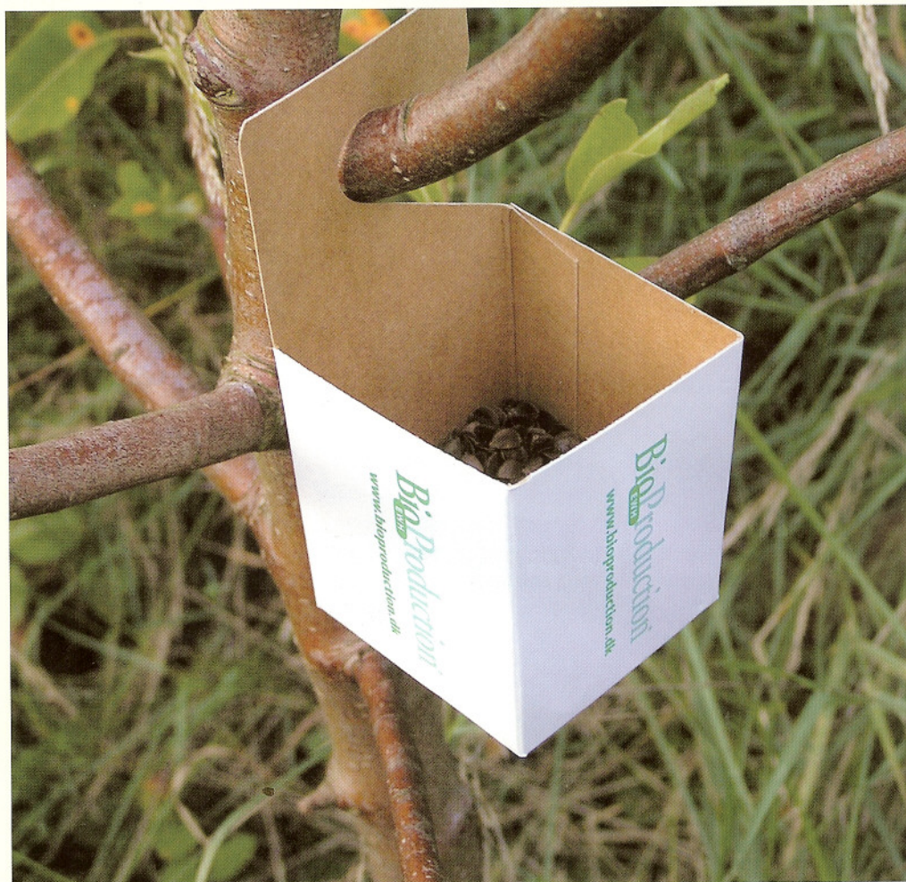
BIOBOKS - Papæske med 10 pærenæbtægenymfer ophængt i pæretre. I æsken fungerer boghvedeskaller som skjul, kornmælg som madpakke og et fugtet stykke papir som drikke.

Der vil dog stadig være år, lokaliteter og forhold, som betyder, at et bladloppeangreb giver udsigt til uacceptable skader. For eksempel umiddelbart efter ophør med brug af sprøjtemidler. En mulighed i denne situation er at udsætte masseopdrættede næbtæger til bekæmpelse af bladlopperne. Pærenæbtægen, Anthocoris nemoralis , æder gerne pærebladloppeæg og nymfer. De findes vildtlevende i Danmark i mange forskellige træer og buske. Almindelig næbtæge, A. nemorum , også kaldet skinnende bladluseæg, er nærtbeslægtet med pære-